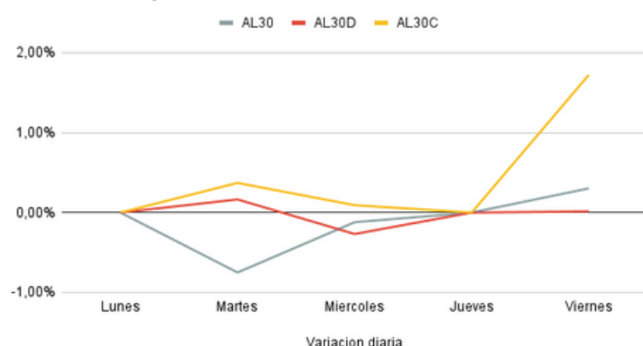
AL30, AL30D y AL30C